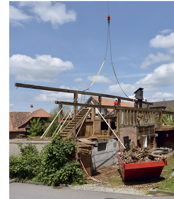
Abbau des Tätschdachhauses an der Junkerngasse 17 im Mai 2014.