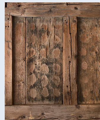
Wandbohle im Gaden mit muldenförmiger Ornamentik.

Die Geschichte des Hauses mit seiner Teilung ist Ausdruck grosser Armut, die im Schwarzenburger Land während des 19. Jahrhunderts herrschte. Sie führte dazu, dass ein altertümlicher Bautyp in Schwarzenburg besonders lange erhalten geblieben ist.