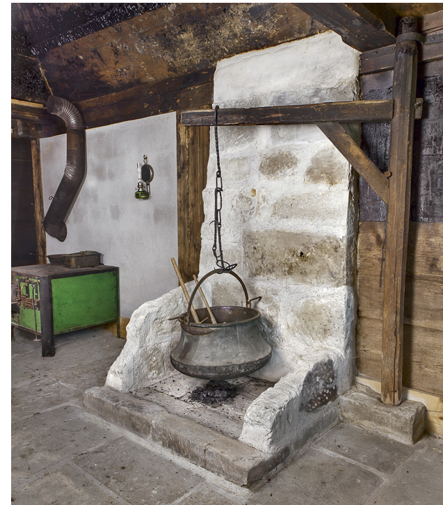
Rekonstruierte Feuerstelle im Tätschdachhaus, sie folgt den Befunden des 19. Jahrhunderts an der Junkerngasse 17.

Das Tätschdachhaus an seinem alten Standort an der Junkerngasse 17 in Schwarzenburg im Jahr 1993. Blick nach Nordwesten auf die Hauptfassade.