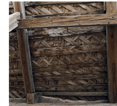
Vordach mit originaler Nagelschindeldeckung an der Junkerngasse 17. Am heutigen Standort fehlt sie. Das Dach zeigt dort eine moderne Dachdeckung.